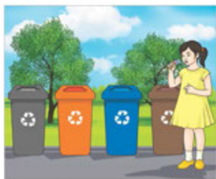
26-сурет. Қалдықтарға арналған контейнерлер