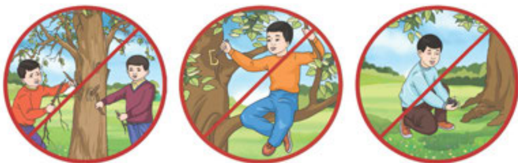
27-сурет. Табиғатты қорғау

Табиғат аясына дұрыс жабдықпен дайындалып бару маңызды: жаяу серуендеуге ауа райының қолайсыздығынан және жарақаттан қорғайтын дұрыс киім мен аяқкиім киген жөн. Серуенге шығатын әрбір адамның өз жолдорбасы болуы керек. Жолдорбаға міндетті түрде телефон, карта, тұсбағар, жылы киім, ысқырғыш, суы бар бөтелке, жаңғақ қосылған шоколад салу қажет. Бейтаныс аймақта серуендеу кезінде әрдайым карта мен тұсбағарды немесе GPS құрылғысын бағдарлау үшін қолдануға болады.