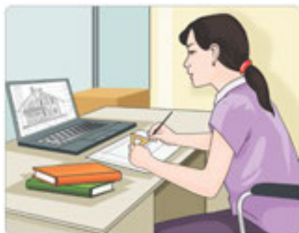
16-сурет. Еңбек түрлері