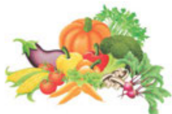
21-сурет. Дәрумендер көзі

ластану адам денсаулығына қауіпті. Денсаулыққа күтім жасау да өз қолыңда. Ой еңбегімен бірге дене еңбегімен шұғылдану, табиғатқа саяхаттау, табиғи таза өнімдерді қолданып, денсаулыққа аса пайдалы дәрумендерге бай жемістер мен көкөністерді жеу күнделікті дағдыға айналуы керек (21, 22-суреттер).