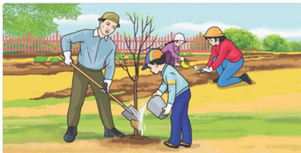
24-сурет. Қошп отырғызу

Тазалық қоқыс пен кірге байланысты аурулар мен аллергия қаупін азайтады. Тұрмыстық қалдық заттар ауаны ластайтын болғандықтан, оларды қоқыс тастайтын арнайы орындарға шығару өте маңызды.