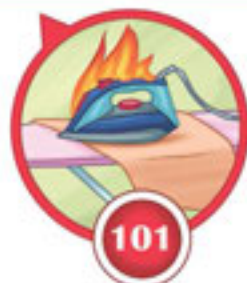
20-сурет. Өрт қауіпсіздігі

Өз қауіпсіздігің өз қолыңда екенін түсіну өзгелердің де өмірін сақтауға мүмкіндік тудырады.