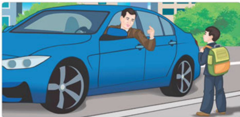
19-сурет. Коше қауіпсіздігіне мысал

Жағдаятты шеш (19-сурет). Ғазиз Азатқа қандай кеңес берді деп ойлайсың?