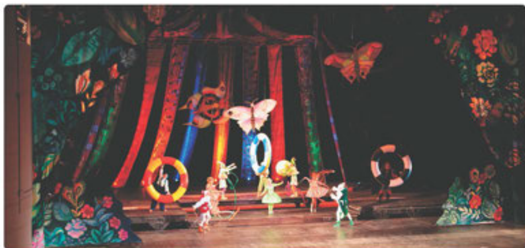
10-сурет. Театрдағы қойылым

Үлкен қалаларда қуыршақ театры, балалар мен жастарға арналған театрлар бар. Театрдағы қойылымдарды тамашалау арқылы адамдар демалып, рухани өседі. Қойылымға әдемі киініп, кемінде 30 минуттай ерте келу қажет.