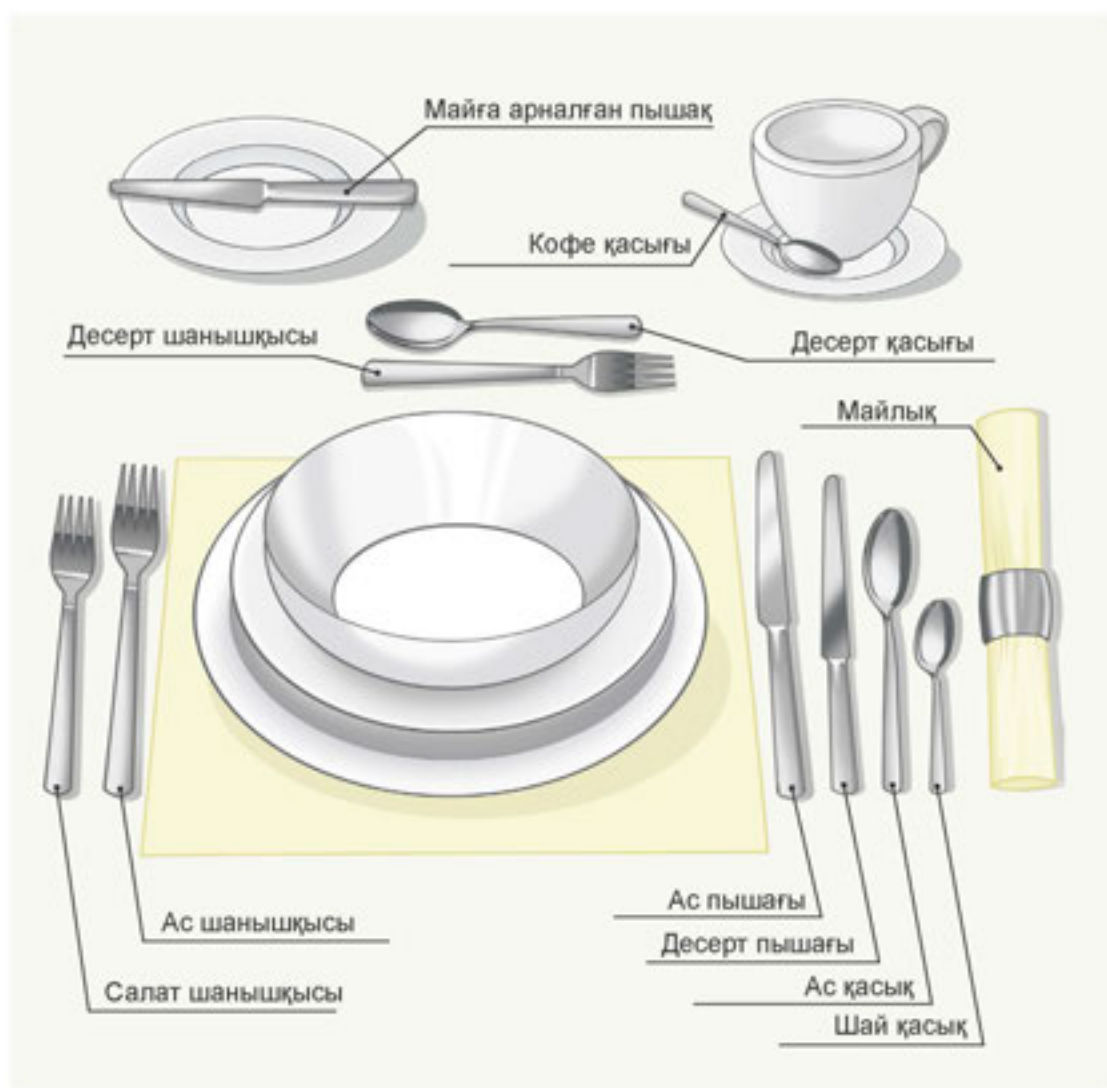
5-сурет. Дастарқан жасау

Дастарқанға отыру үлкендердің төрге жайғасуынан басталады. Тамақтану кезінде дабырлап сөйлеу, кітап оқу, телефонға алаңдау – әдепсіздік.