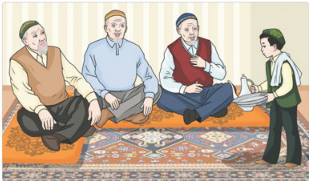
4-сурет. Қолға су құю дәстүрі

Дастарқанға қол жумай отырмайды. Халқымызда ежелден келе жатқан қолға су құю дәстүрі бар. Үлкендер су құйған балаға «Ғұмырлы бол! Таудай азамат бол! Бақытты бол!» деп алғыс білдіріп, бата береді (4-сурет).