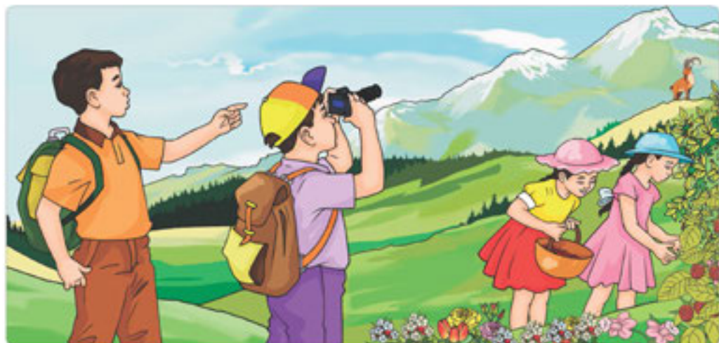
22-сурет. Табиғатта серуендеу

Жұқпалы аурулар маусымы кезінде де сақтық шараларын ұстан. Адамдар көп жиналған орында бетперде киюді ұмытпа.