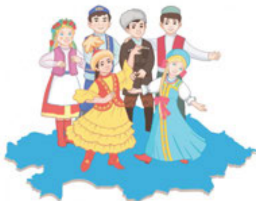
13-сурет. Халықтар достығы

Ұлттың төлтума мәдениетін, дәстүрлерін сақтау – әр ұлт үшін маңызы бар мәселе. Қазақстан – осы мәселені шешіп, құрамындағы ұлттардың құқығын қорғап отырған мемлекет (13-сурет).