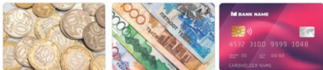
15-сурет. Ақша түрлері

Адам жұмыс істегенде күш жұмсайды. Ол білек күші немесе ақыл-ой еңбегі болуы мүмкін (16-сурет).