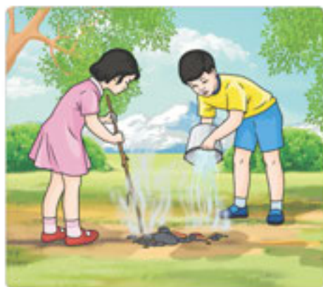
28-сурет. Табиғатты аялау