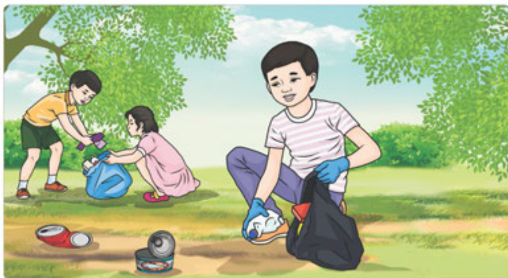
25-сурет. Ауланы тазарту

Сен де өзің тұрған жерде аула тазалығына назар аудар. Қоқыс тастайтын орынның ластанғанын байқасаң, үлкендерге немесе арнайы тұрғын үй мәселесімен айналысатын орындарға ескерт. Сенбіліктерге қатыс, ауланы көрікті етуге атсалыс. Ауланы таза ұстау – өз мекеніңе, туған жерге деген құрмет екенін есінде ұста. Өзгелердің түсінуіне үлес қос. Мысалы: аула тазалығын сақтау туралы бейнетүсірілімдер жасауыңа болады. Аула тазалығының табиғат пен биоәртүрлілікті сақтауға ықпал етуі туралы зерттеу жұмысын қолға алып, ғылыми жоба байқауына қатысуыңа болады. Аула тазалығы мен ерекше безендіру идеяларын жүзеге асыратын топ құруға болады және т.б.