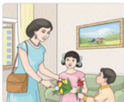
2-сурет. Ананы құттықтау

Адамгершіліктің ең жоғары сатысы – айналадағы адамдардың өміріне жауапкершілікпен қарау. Адам ата-анасын, бауырларын, достарын, өзімен бірге өмір сүріп жатқан жандарды бағалай білуі керек. Әсіресе үлкендерді құрметтеу ұрпақтан-ұрпаққа аманат десек те болады. Ата-ананы ардақтаумен бірге, оларға өз ризашылығымызды білдіру де аса маңызды.